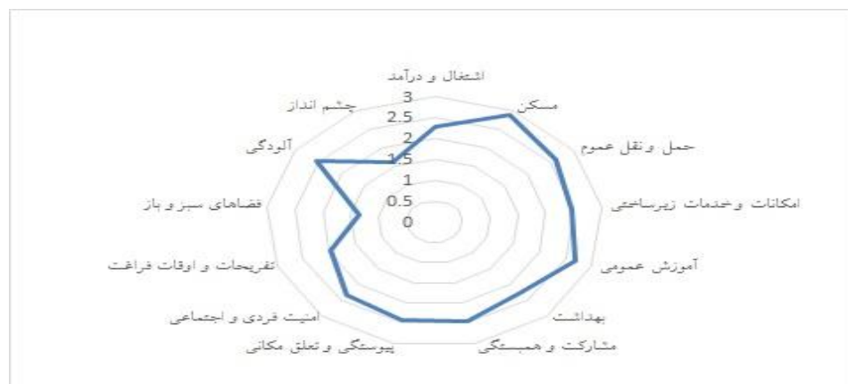
شکل ۱ - وضعیت شاخص های زیست پذیری در روستاهای مورد مطالعه

اما بالاترین دامنه نوسان مربوط به مولفه اشتغال و درآمد و پیوستگی و تعلق مکانی است. طبیعی است که با توجه به مهاجرپذیر بودن این روستاها، زنانی که مهاجر بوده و غیربومی هستند، از وضعیت شغل و درآمد نامطلوب تری برخوردار باشند و همچنین میزان تعلق مکانی کمتری را تجربه کنند و در نقطه مقابل از نظر این دو شاخص زنان بومی قرار داشته باشند. لذا می توان این دامنه نوسان را طبیعی و قابل پیش بینی دانست.