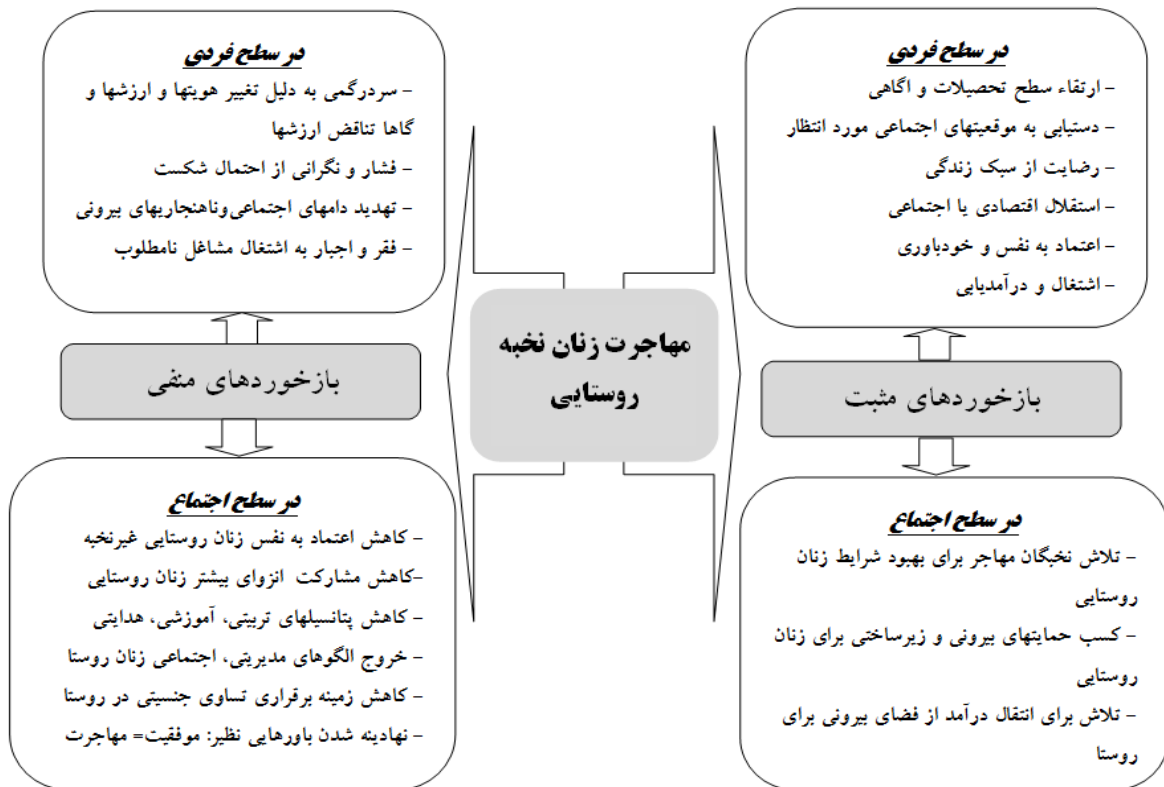
شکل ۳- بازخورد مهاجرت زنان نخبه بر فضاهای روستایی

کاهش نقش هدایتی، آموزشی، اجتماعی، بهداشتی، مدیریتی زنان به واسطه خروج الگوهای پیشدار برای سایر زنان روستایی با توجه به روحیه الگوپذیری زنان روستایی از مهمترین بازخوردها و عواقب خروج زنان نخبه از نواحی روستایی به شمار می آید. البته لازم به ذکر است که مهاجرت زنان در سطح خانواده خود آثار منحصر و ویژه خود نظیر گسستگی ساختار خانواده، تغییر سبک زندگی فرزندان و مرد خانواده، کاهش توان کاری خانوار روستایی و نظایر آن را به همراه خواهد داشت. از سویی آثار مثبت آن را در صورت موفق بودن فرد مهاجر در یافتن موقعیت اجتماعی مطلوب و مورد انتظار خود در فضای بیرونی، می توان محدود و در سطح شخص مهاجر کننده و شامل مواردی نظیر دستیابی به مدارج بالاتر اجتماعی، اقتصادی و رفاهی، رضایت فردی از زندگی شخصی از آثار مثبت در ابعاد فردی دانست که تنها در صورت تلاش زنان مهاجر نخبه از روستاها برای تغییر شرایط زندگی سایر زنان روستایی می توان آن را کمی فراتر از بازخوردهای فردی و در سطح اجتماعی نیز قلمداد نمود.